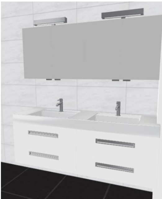
Badkamermeubel 'Frost White' met dubbele wastafel, wandspiegel, verlichting en kranen.